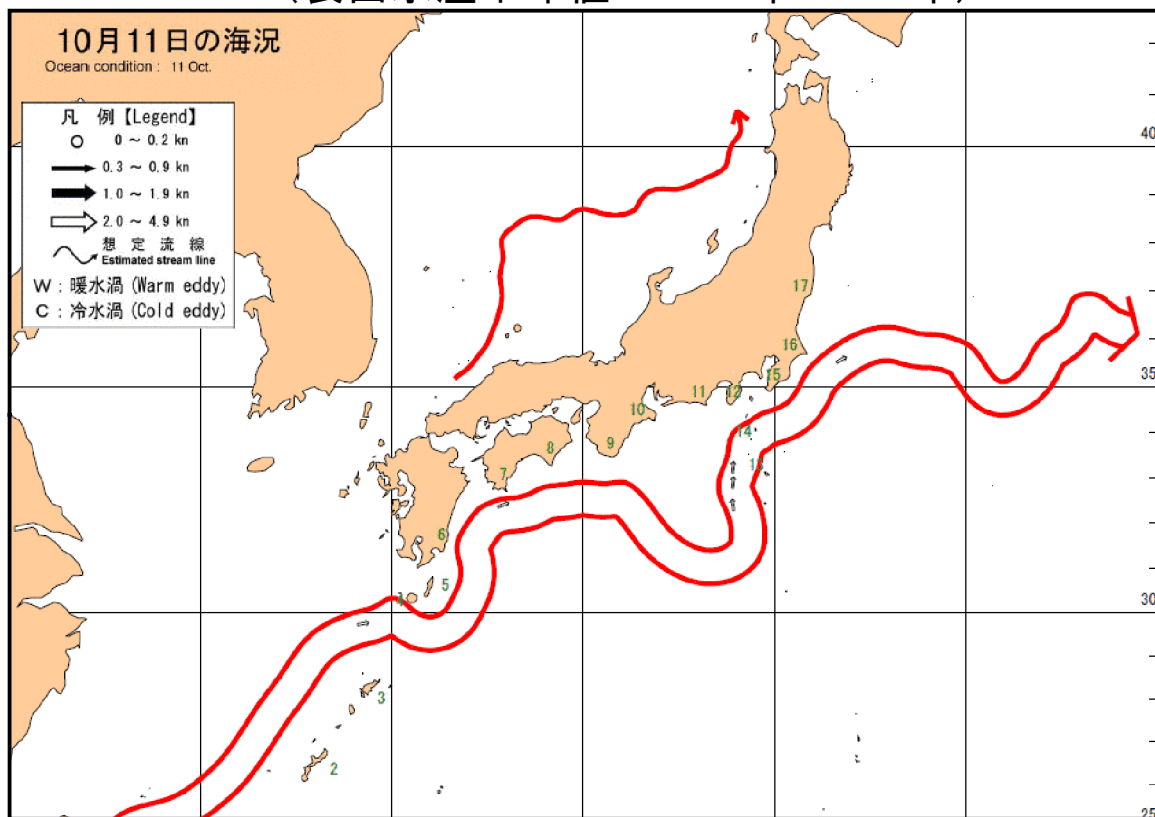
海上保安庁「海洋速報平成29年第193号」 黒潮流路 (観測期間：平成29年10月4日-平成29年10月11日)