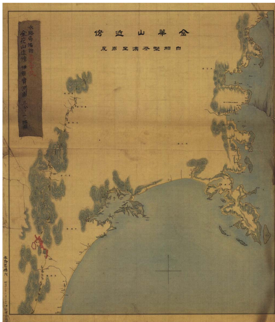
伊能図模写図「金華山近傍」