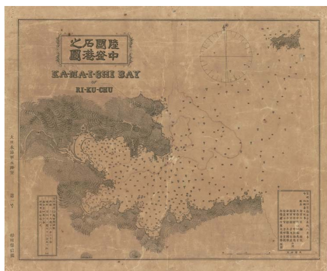
海図「陸中國釜石港之圖」 明治5年(1872年)