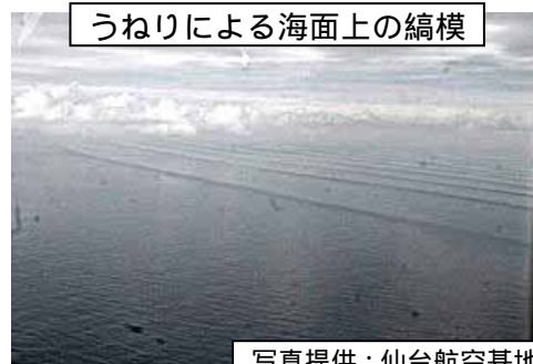
写真提供 : 仙台航空基地

資料の出所 : 岩手県水産技術センター 千葉県水産総合研究センター 静岡県立焼津水産高校 東北水産研究所 海洋開発研究機構 防衛省 気象庁 海上保安庁 漁業情報サービスセンター 気象衛星 NOAA