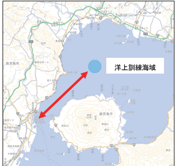
図4 洋上訓練海域 (鹿児島湾内)

(海洋状況表示システム ( https://msil.go.jp/ ) を加工して作成)